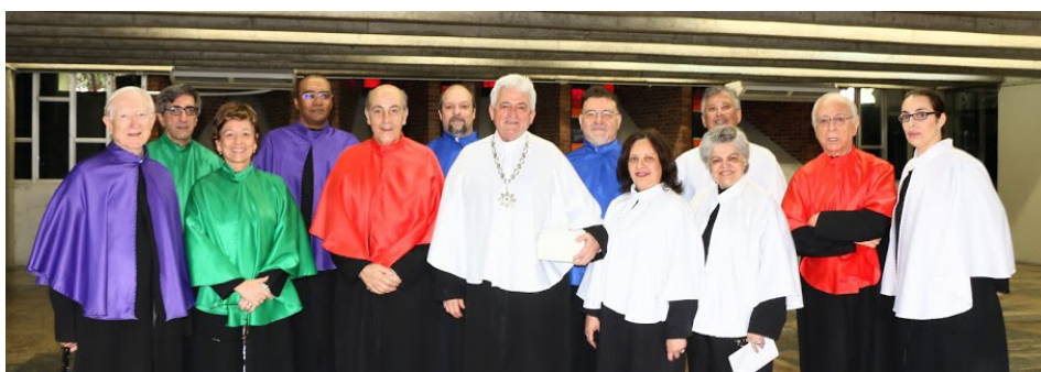
A cerimônia, realizada na Capela Ecumênica, reuniu membros da administração central, docentes, técnico-administrativos e estudantes